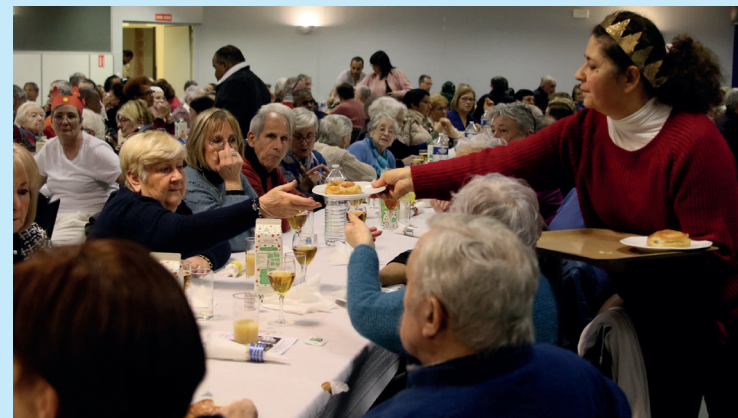
Mercredi 1 er février : un temps convivial avec la galette des Rois